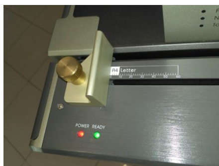
Ajuste del tope lateral.

Los sistemas RECO de encuadernación Changer PUNCH 4 es perfecto para el trabajo en copisterías y centros de gráficos con gran producción de encuadernaciones. La característica que destaca en las encuadernadoras Reco es su gran flexibilidad. Los robustos peines de perforación se pueden intercambiar en segundos. Dispone de peines de intercambio para: encuadernación de plástico, wire-o paso 2:1 y 3:1, así como de espiral. La activación de funcionamiento puede ser mediante interruptor de pedal o sensor de papel, lo que permite un proceso agil que aumenta la productividad.