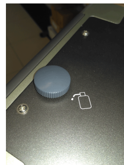
Punto de engrase para un adecuado mantenimiento del equipo.